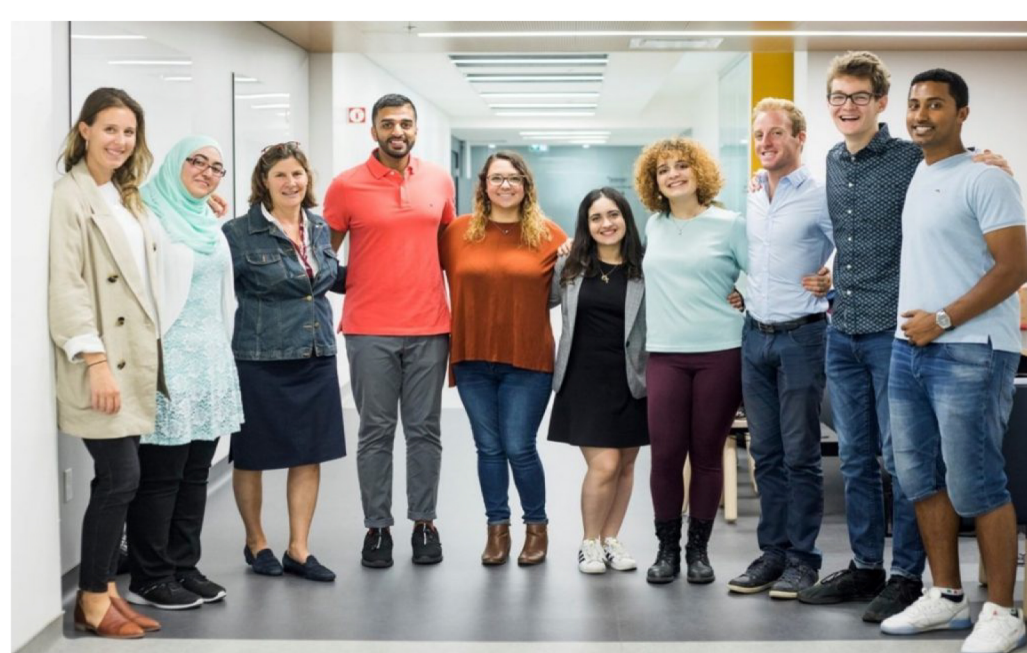
Image : L'équipe de FutureBound, le centre de réussite étudiante de l'Université Concordia

Cette première phase comprend deux cours (SKIL 402 et SKIL 403) offerts de manière asynchrone. Ceux-ci comportent quatre heures d'ateliers en ligne ainsi qu'une heure d'activités préparatoires chaque semaine, pour un total de 33 heures de formation.