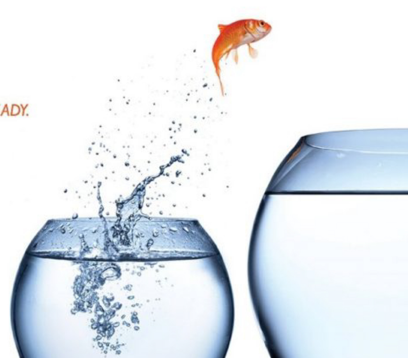
Image : FutureBound, le centre de réussite étudiante de l'Université Concordia, 2021